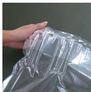
エアを注入する際は、反対側の注入口を塞ぐ。