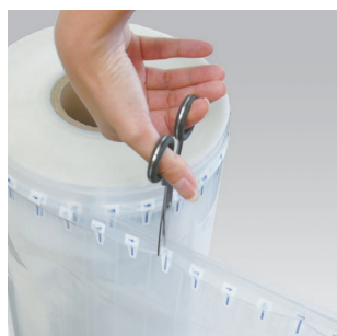
必要なサイズをカットして使用。