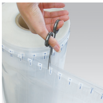
必要なサイズをカットして使用。