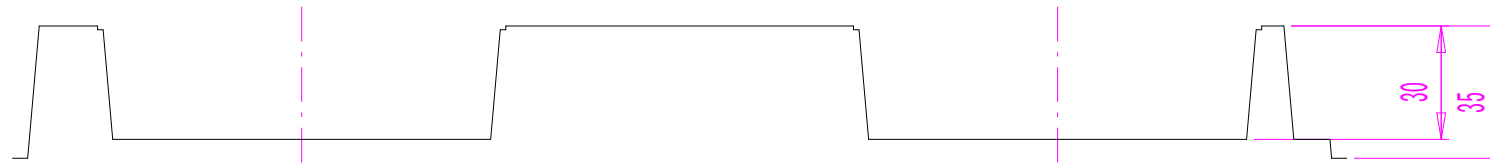
A - A 断面