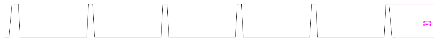
A - A 断面